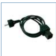
230 V meetsnoer