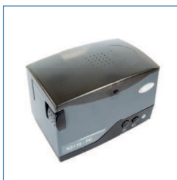
Label printer (Test'n Tag printer, lichtgewicht)