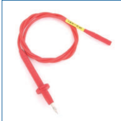
Isolatie testsnoer (rood, t.b.v. PAT3140 en PAT3140S)