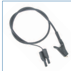
Massa aansluitsnoer (zwart, t.b.v. PAT3140)