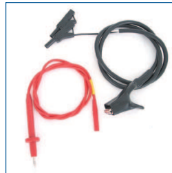
Massa en isolatiesnoer (t.b.v. PAT3140S)