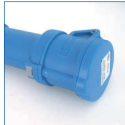
Adapter, 1PNA16 (1-fase 16A CEE aansluiting)