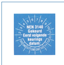
Keuring stickers (set van 100 stuks, diameter 25 mm, met datumaanduiding)