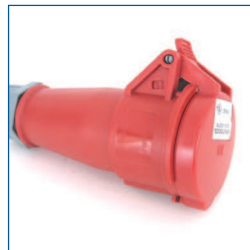
Adapter, 3PA16 (3-fasen 16A CEE aansluiting, 3 fasen + aarde)