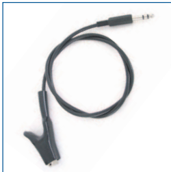
Massa aansluitsnoer (zwart, t.b.v. PAT3140)