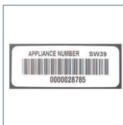
Barcode labels (set van 250 stuks, voorbe- drukt)