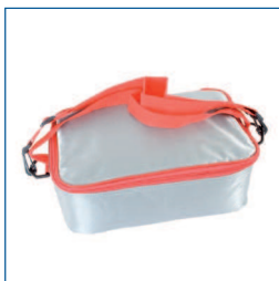
Draagtas (T.b.v. Test'n Tag kit)