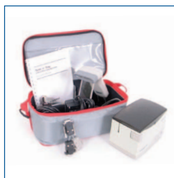
Test'n Tag kit