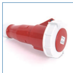
Adapter, 3PA63 (3-fasen 63A CEE aansluiting, 3 fasen + aarde)