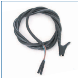
Massa aansluitsnoer (zwart, 3 meter, t.b.v. PAT3140)