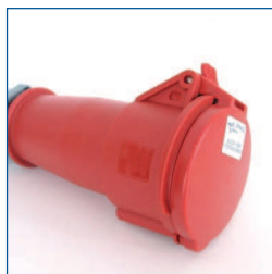
Adapter, 3PNA32 (3-fasen 32A CEE aansluiting, 3 fasen + nul + aarde)