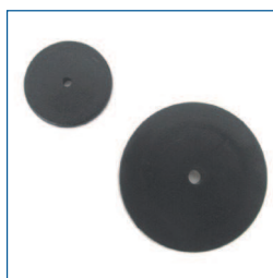
RFID-chip (Popnagelmontage, voor registratie van testgegevens. Kunststof epoxy. Frequentie 13,56 MHz)

artikel nummers: 626 000 569 (33 mm) 626 000 570 (50 mm)