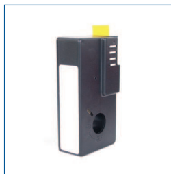
Cartridge (zwart, t.b.v. Test'n Tag labelprinter)