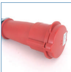
Adapter, 3PA32 (3-fasen 32A CEE aansluiting, 3 fasen + aarde)