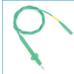
Isolatie testsnoer (groen, t.b.v. PAT3140 en PAT3140S)