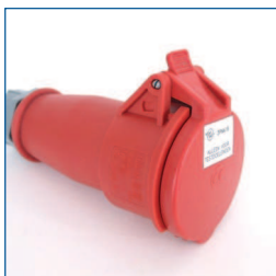
Adapter, 3PNA16 (3-fasen 16A CEE aansluiting, 3 fasen + nul + aarde)