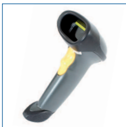
Barcode scanner (RS232 aansluiting)