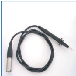
Testprobe (kabel en 3 polige connector voor isolatie en massatests, t.b.v. MultiPAT modellen)