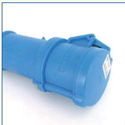
Adapter, 1PNA32 (1-fase 32A CEE aansluiting)