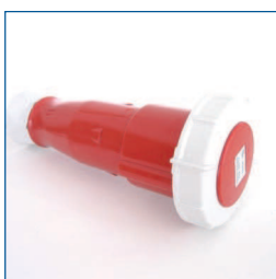
Adapter, 3PNA63 (3-fasen 63A CEE aansluiting, 3 fasen + nul + aarde)